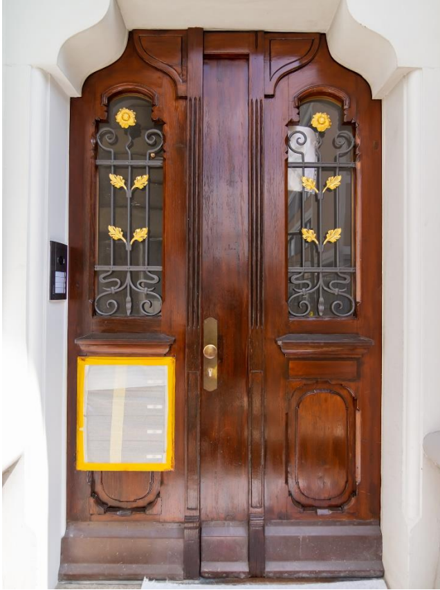
Restaurierte schöne Hauseingangstüre