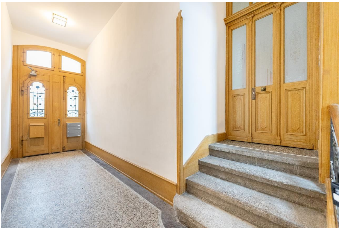
Restaurierte Wohnungseingangstür mit Charme der Gründerzeit