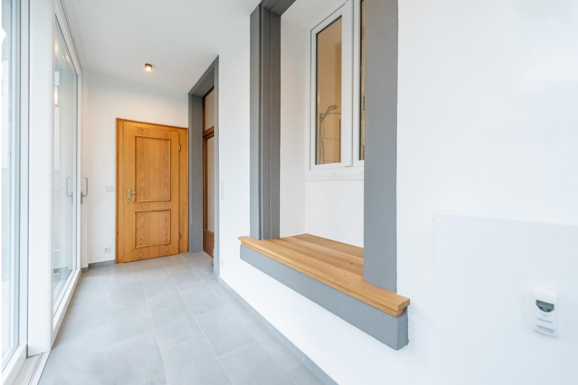
Blick in die Laube von der Hofseite