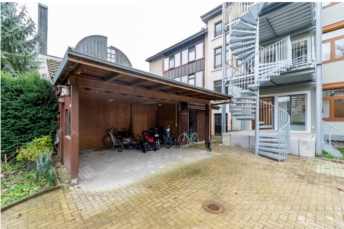
Freisitz im Gemeinschaftshof