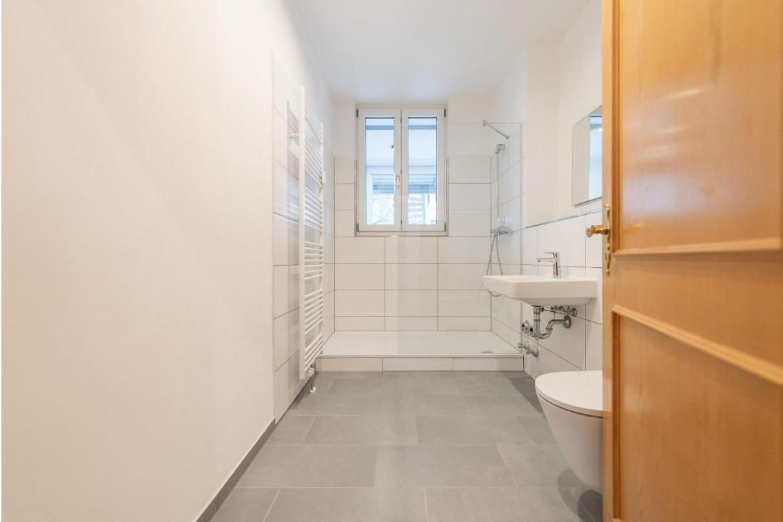
Helles modern saniertes Tageslichtbad